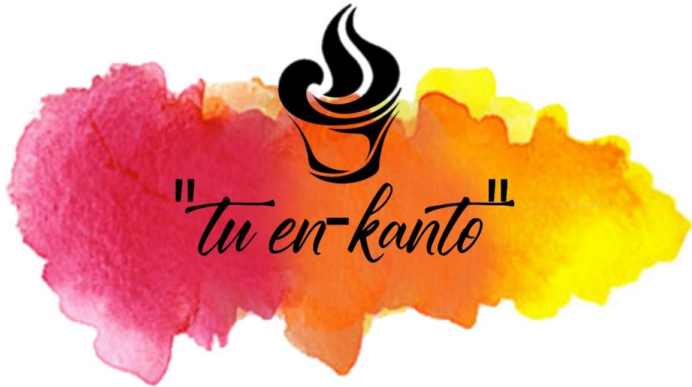
Empresa de Pastelería